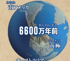
制作・配給：D&Dピクチャーズ / 制作協力：NHK エンタープライズ / 映像提供：NHK