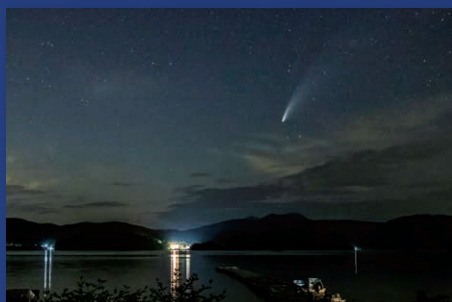
審査員特別賞 渡部潤一選賞