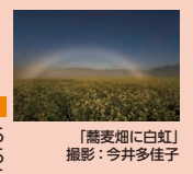
「蕎麦畑に白虹」